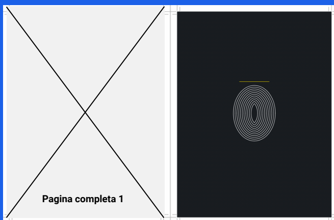
Pagina 01 (retro copertina)