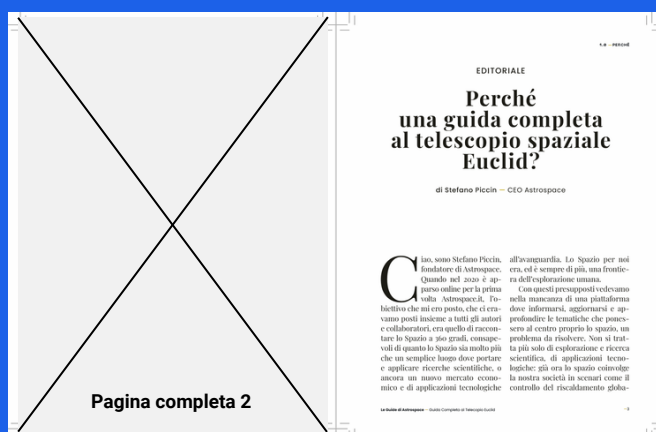
Pagina 03 (prima dell'editoriale iniziale)