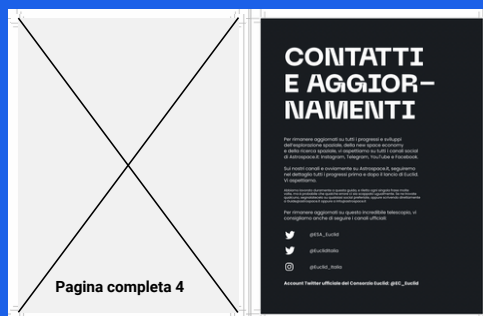
Pagina finale (terzultima pagina)