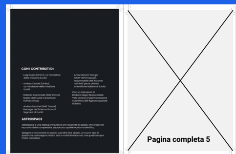
Pagina finale 3 (retro copertina)